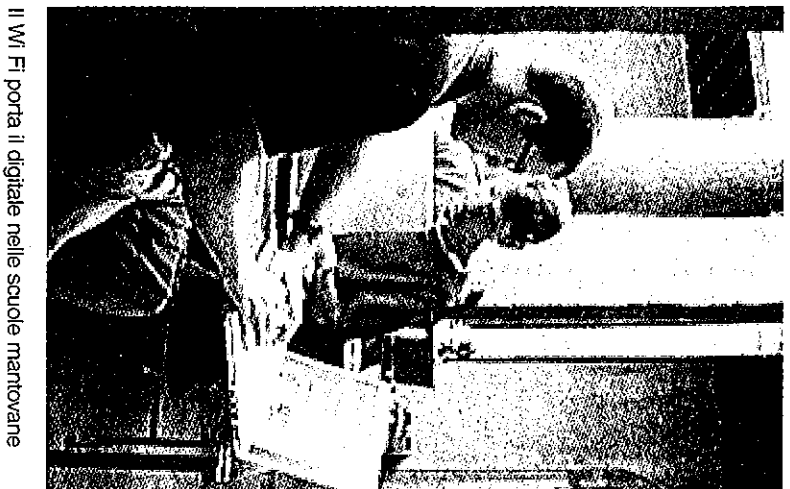
Il Wi-Fi porta il digitale nelle scuole mantovane

Si è riunito al Dipartimento per la digitalizzazione della Pubblica amministrazione e l'Innovazione tecnologica il Comitato incaricato di esaminare le richieste delle istituzioni scolastiche per l'assegnazione del Kit Wi-Fi, previsti dall'iniziativa "Scuole in Wi-Fi", voluta dal ministro Renato Brunetta. Il Comitato ha approvato tutte le richieste pervenute fino alle ore 15 del 25 maggio: 1.791 scuole riceveranno così altrettanti Kit Wi-Fi per realizzare reti di connettività senza fili all'interno dei loro edifici, dedicate a offrire servizi innovativi sia di tipo didattico che amministrativo. Le scuole Complessivamente le richieste ad oggi pervenute sono 1.850 distribuite su tutte le regioni. Tra queste ci sono 10 scuole mantovane: Liceo classico "Virgilio" di Mantova, Liceo scientifico "Belfiore" di Mantova, Istituto tecnico per geometri e ma-